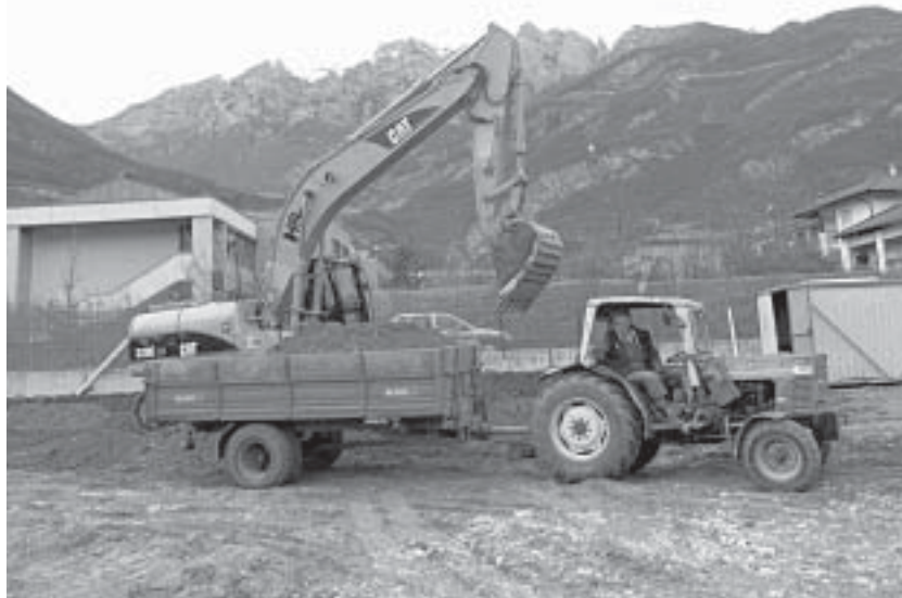
Le ruspe preparano l'area per la nuova scuola materna e l'asilo nido.

E' in fase di partenza anche la ristrutturazione della scuola me-