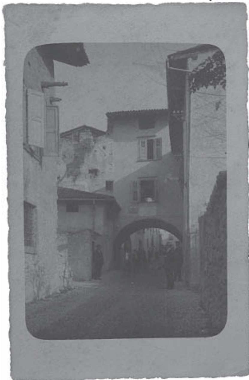
1930: l'arco di via III Novembre.

Foto scattata in occasione dell'ampliamento della Cantina Sociale di Aldeno, fondata nel 1910. Del fabbricato sono documentati due ampliamenti: uno nel 1913 e uno nel 1923. L'immagine conferma lo spirito mutualistico che da sempre ha