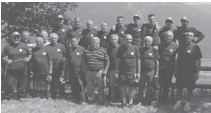
La sezione cacciatori di Aldeno.