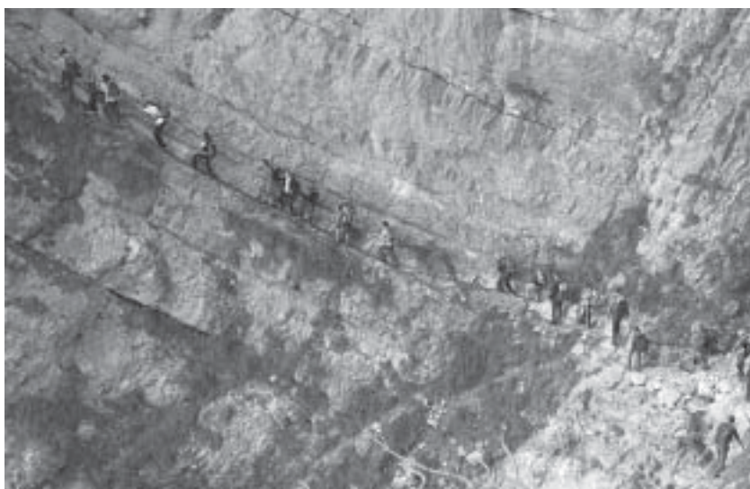
Salita da brivido, lungo il sentiero attrezzato.

ne anche dagli operai della squadra forestale della nostra zona.