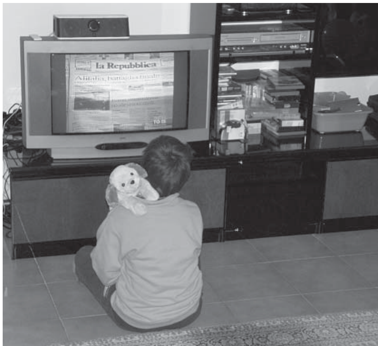
Non così, solo davanti alla TV.