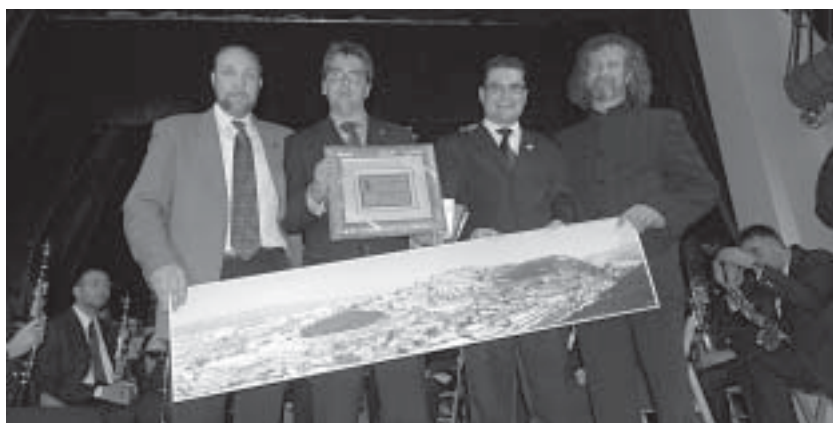
Presidenti e maestri delle due bande.

Auguriamo al nostro pubblico sinceri auguri di Buon Natale e Felice Anno Nuovo. □