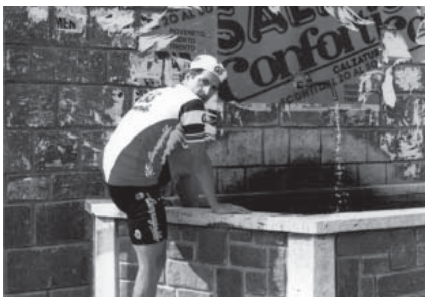
La fontana e Moser: benvenuto ad Aldeno.