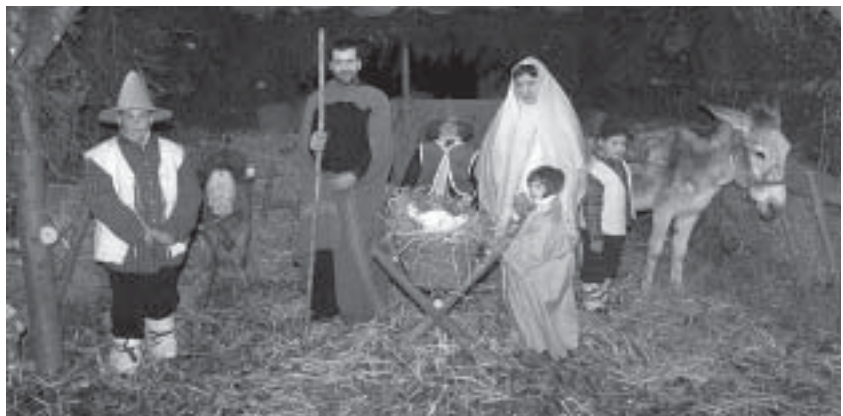
Il presepe vivente a Cimone.

Che occasione "fare il presepe" per far nascere Gesù anche dentro di sé, per rivivere con amore l'evento di Betlemme! Che occasione per ricordarci con le parole di Silesio che "Nascesse pure mille volte Gesù a Betlemme, non serve a nulla se non nasce in te..." Buon Natale. □