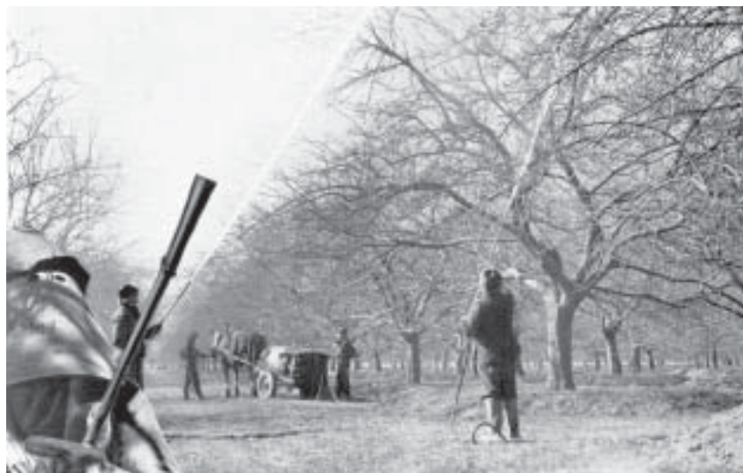
Così, cinquant'anni fa, si irroravano gli alberi da frutto.