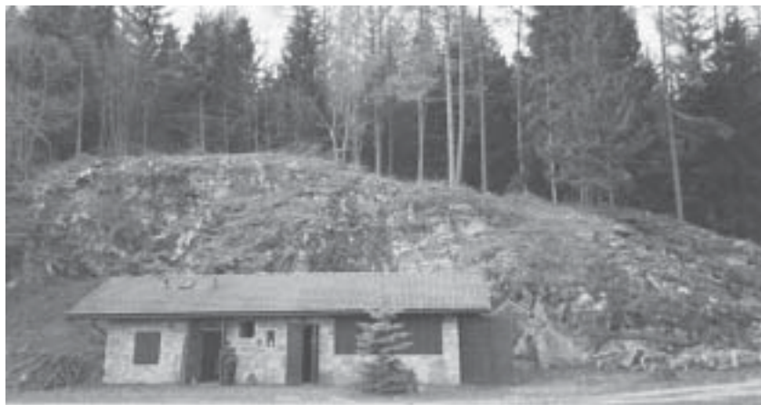
La casetta forestale di Valstornada di sopra.

In seguito si provvederà alla sistemazione del tetto e l'interno. Tutte queste operazioni hanno comportato ben oltre 700 ore lavorative. La direzione ringrazia in particolar modo i soci lavoratori che, con il loro impegno e la loro solerzia, hanno permesso tutti questi interventi. Con l'occasione delle imminenti festività porgiamo a tutti i soci e alla comunità i più sinceri auguri di buone feste. □