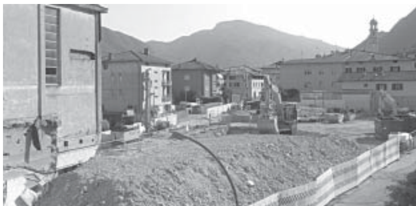
Gli scavi per la struttura ITEA, sulle fondamenta delle vecchie cantine.

E se nel 1957 la mia mamma ha ammirato la costruzione di una parte di Cantina, oggi i miei figli la vedono cadere, svelando il segreto dei suoi labirintici sotterranei: le tine che hanno custodito per lunghi anni il frutto del lavoro di centinaia di agricoltori. □