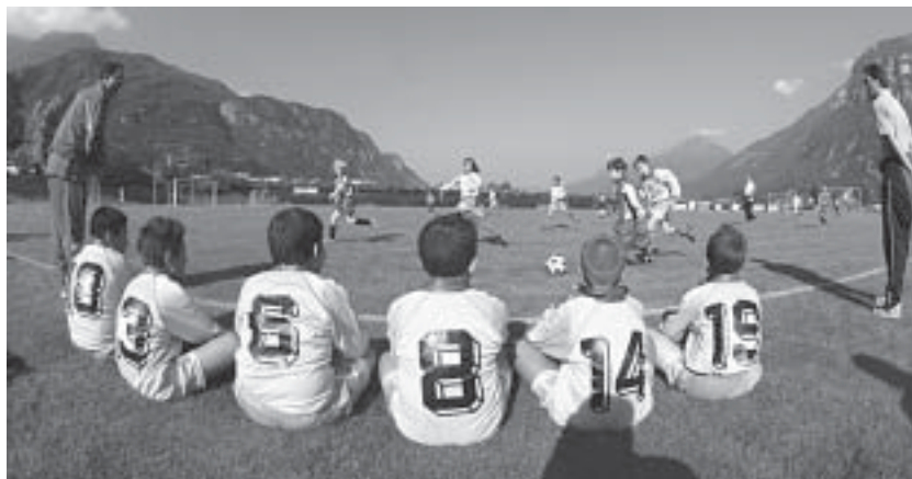
Pulcini in allenamento.

In questo contesto è evidente e soprattutto triste, come si abbia perso il valore dello sport, insostituibile occasione di crescita per i nostri ragazzi, una crescita fondamentalmente fisica, psicologica e sociale. Un ragazzo, diventando adulto, ricorderà dello sport praticato soprattutto le persone: alle-