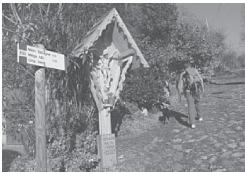
Il crocifisso alla partenza del sentiero 630.

La SAT segnala inoltre, a chi non l'avesse già visto, la posa di un bel crocifisso alla partenza del sentiero 630, realizzato, a cura della sezione, da un artista che vuole mantenere l'anonimato. □