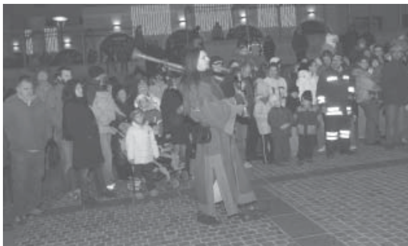
Un momento della Santa Lucia aldenese.

Aldeno e dintorni. Un grazie particolare alle amiche che si cimentano come maestre di manualità per una domenica all'anno.