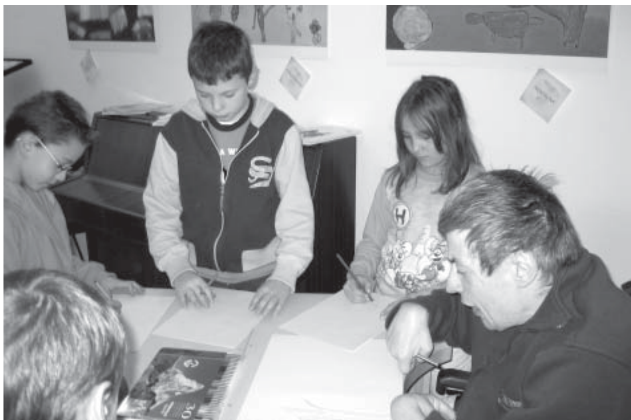
Gli alunni delle elementari all'opera insieme ai ragazzi dell'ANFFAS, nei laboratori organizzati a corredo della mostra.