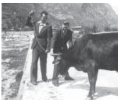
Sulla sponda dell'Arione, si tratta la compravendita di un bue.