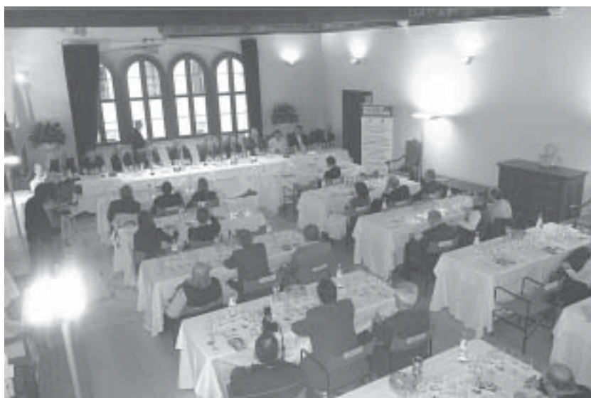
La degustazione dei vini vincitori del concorso a Palazzo Geremia, a Trento.

Inizio quindi alla grande e sempre in crescendo. Perché la gamma dei Merlot in passerella - 126 se si contano quelli proposti da una decina di aziende brasiliane - ha soddisfatto pienamente le aspettative dei degustatori più preparati. Merlot variegati, ma anche Merlot di pregio assoluto come i Top, mirata selezione svincolata dalla rassegna, che ha offerto il meglio del meglio con la possibilità di degustare vini bla-