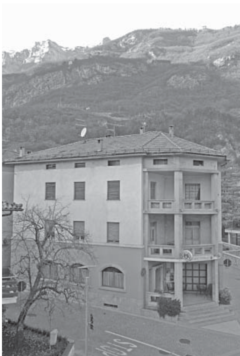
Nell'edificio delle ACLI si collocherà il nuovo ostello.