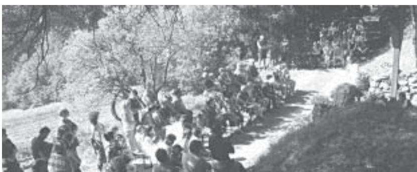
La Messa di Valstornada.