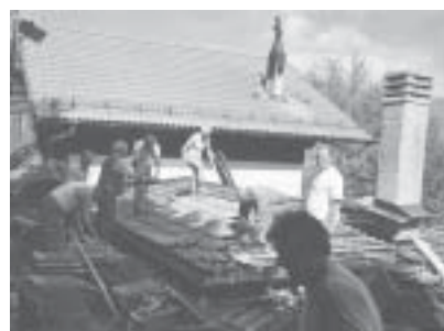
Una fase dei lavori sulla tettoia.