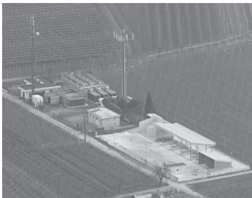
Il nuovo Ecocentro per la raccolta dei materiali.

Per quanto riguarda la nuova palestra siamo in attesa che l'Ente provinciale ci fornisca informazioni in merito al finanziamento dell'opera.