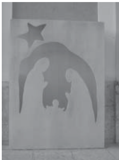
Il presepe della Pro Loco, davanti alla Chiesa.

Laboratorio manuale “CREARE GIOCANDO”: un itinerario manuale creativo che vede protagonisti i bambini e che termina con un Nutella party. Giornata colorata, divertente, golosa e alternativa alla solita televisione, che la Pro Loco vuole proporre ai bambini di