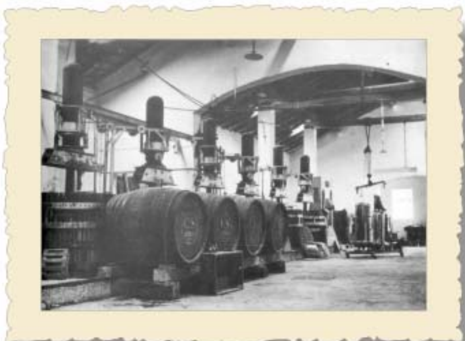
Prima metà del '900: una sala di lavorazione della Cantina Sociale di Aldeno.