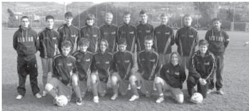
La squadra dell'Aldeno, formazione allievi.

I ragazzi e lo sport: uno dei pochi matrimoni che avranno sempre successo, nonostante la società di oggi lo renda estremamente più difficoltoso e ricco di tentazioni di evasione... ma forse anche per questo più emozionante, quando riesce. E la Società Sportiva Aldeno è fiera di celebrarlo in ogni anno della sua storia, ormai più che ventennale. □