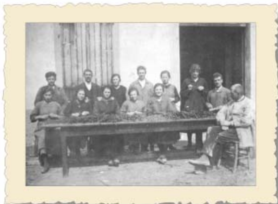
Primi decenni del '900: anche le donne davano il loro contributo in cantina. Qui sono impegnate nella preparazione degli innesti delle barbatelle.