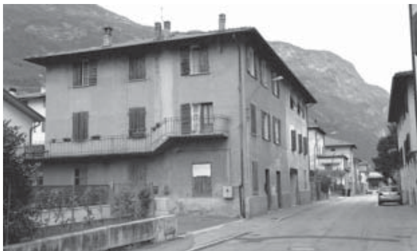
Casa Gottardi in via Florida.

lungo la mulattiera che congiunge ancor oggi i due paesi.