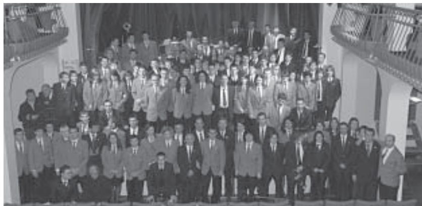
La Banda di Aldeno, con gli ospiti spagnoli di Banyeres de Mariola in teatro.