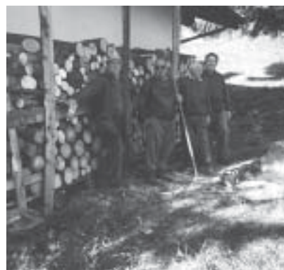
La sistemazione della legna al rifugio comunale.

la tettoia con stesura di guaina e tavolato, tagliata l'erba nei prati con recupero e imballatura del fieno. Inoltre è stata sistemata la strada di accesso con legante, ottenendo un buon risultato, ma che purtroppo la tempesta del 9 Luglio ha distrutto. Ci siamo rimboccati le maniche e l'abbiamo risistemata, rendendola agibile per la Festa del Cacciatore del 22 Luglio. Data la nostra disponibilità, il Comune ci ha dato in uso anche la casetta ex Forestale di Valstornada di Sopra, per il deposito dei nostri attrezzi (falciatrici, trattorino con bilico, decespugliatori ed attrezzi vari). Abbiamo cominciato la bonifica dell'immobile e la sistemazione antistante, pulendo tutto il dosso a monte dell'edificio.