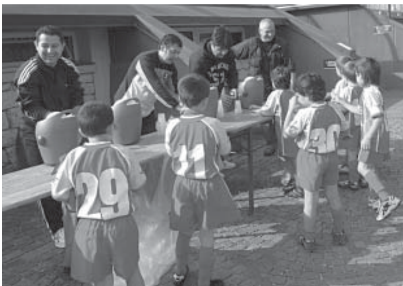
Sport, ma anche divertimento a bordo campo.

Il genitore non dovrebbe preoccuparsi troppo delle sconfitte del figlio, ne esaltarsi per le sue vittorie, non sono queste le cose più importanti del fare sport; deve assicurarsi di trovare un ambiente il più sano e pulito possibile, degli allenatori corretti e preparati, dei dirigenti, sebbene volontari, di-