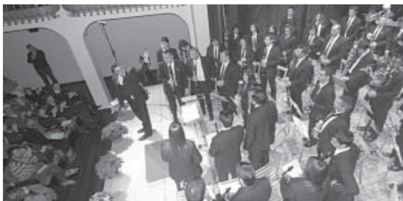
Il concerto del gruppo spagnolo.

clamava anche il manifesto che ha pubblicizzato l’incontro umano e musicale con gli amici della Societat Musical Banyeres de Mariola, ospitati ad Aldeno dal 5 al 9 Dicembre scorsi. Se mai avessimo avuto bisogno di una conferma, possiamo tranquillamente dire che l’abbiamo avuta. Le emozioni e le sensazioni che a Dicembre 2006 provammo durante la nostra permanenza a Banyeres de Mariola, si sono ripresentate a noi con la stessa intensità nell’istante preciso in cui si sono aperte le portiere dell’enorme pullman che ha portato i nostri amici dall’aeroporto di Bergamo ad Aldeno, ed i passeggeri sono scesi. L’impressione è stata identica per tutti: sembrava di essere stati insieme appena poco tempo prima. Abbracci calorosi e sincere parole di amicizia, brividi di gioia, oltre ai brividi di freddo. Gli ospiti sono arrivati la sera di mercoledì 5 Dicembre e, dopo la sistemazione nelle famiglie, alcuni hanno trascorso una serata a cena in casa, mentre altri hanno cenato alla Birreria Dartagnam. Nei giorni successivi all’arrivo, hanno visitato Verona, Riva del